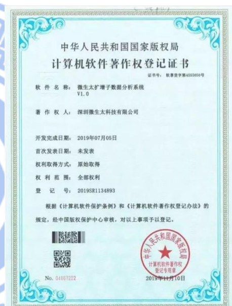
《微科盟扩增子数据分析系统》软著证书